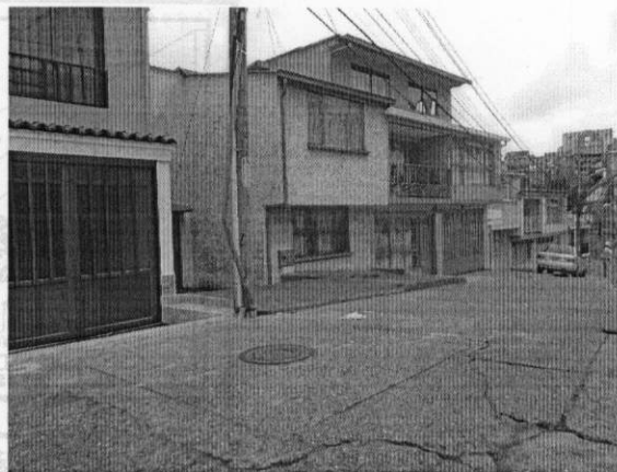
Área de pavimento afectado: 50M2 aproximadamente