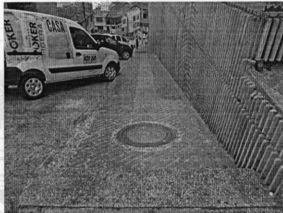
Área de andén solicitado: 53 M2 aproximadamente