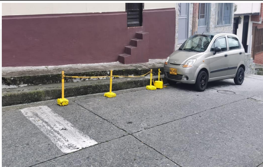
Foto No. 1. Predio con dirección Carrera 28 29 27 Campoamor, se evidencia ocupación de vía con bolardo