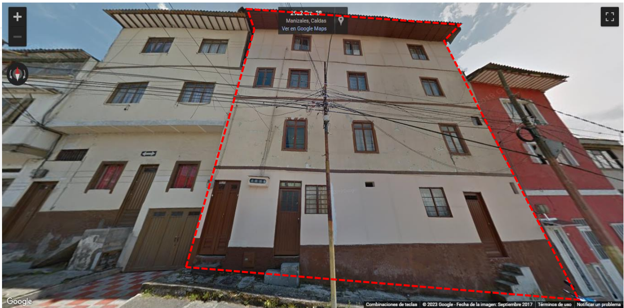
IMAGEN No 2. Imagen tomada por Google Street View, septiembre 2017.