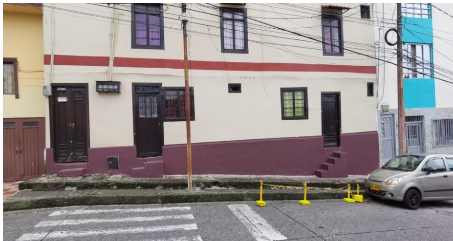
Foto No. 2. Ocupación de vía con bolardos y parqueo sobre la misma, obstruyendo el paso de los demás vehículos circulen.