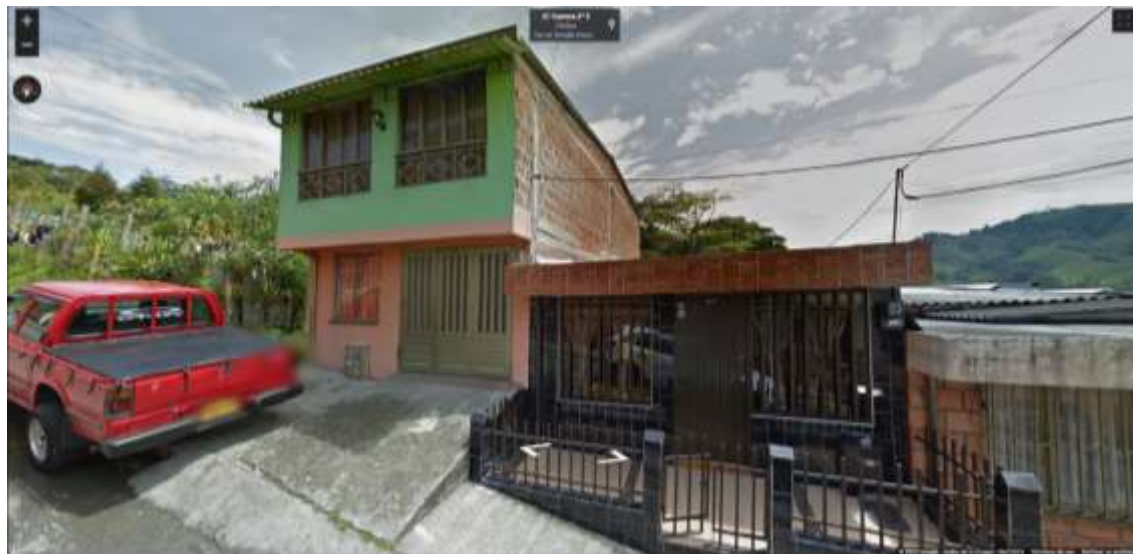
IMAGEN No 2. Imagen tomada por Google Street View, abril de 2013.