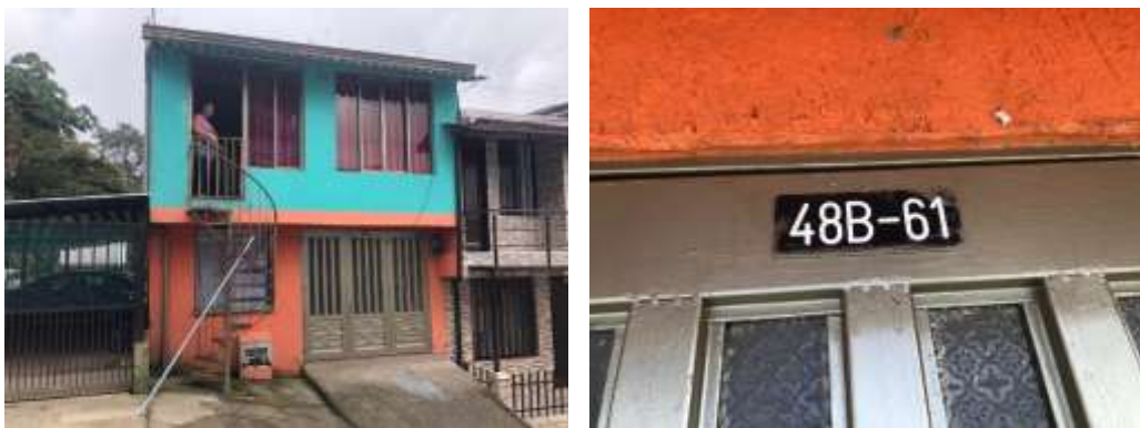
Foto No 1 y 2. Fachada principal del predio y nomenclatura