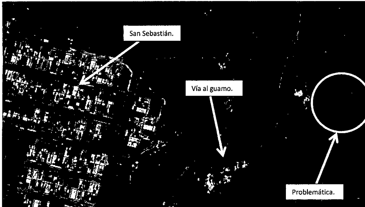
Imagen 1: Localización general.

Una vez conocida la solicitud de visita técnica, se destinó personal de la Unidad de Gestión del Riesgo de Manizales, para realizar una inspección visual en una vivienda localizada en el Alto del Guamo, dando como resultado las siguientes observaciones: