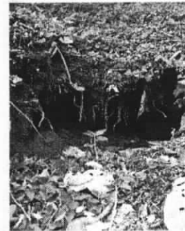
Caverna que se ha formado porque el dren tiene su salida muy profunda