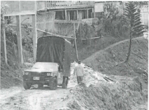
Foto No. 3 Vertimiento de escombros