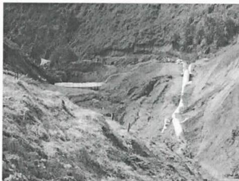
Foto No. 2 Escombrera