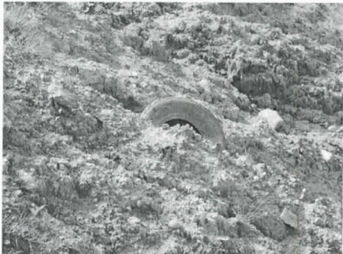
Foto No. 1 Escombros