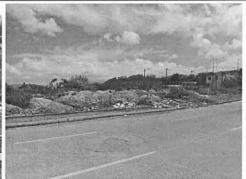
Entrada Barrio Asis