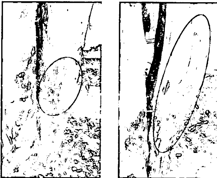
Ruptura de los arboles

Por lo anterior, se envía copia de este oficio a la Secretaría de Medio Ambiente a fin de que verifiquen el estado actual de los árboles del sector y emitan las recomendaciones del caso.