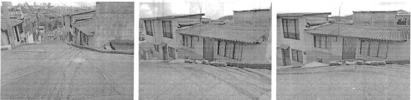
Longitud de sardinel afectado: 3 ML aproximadamente