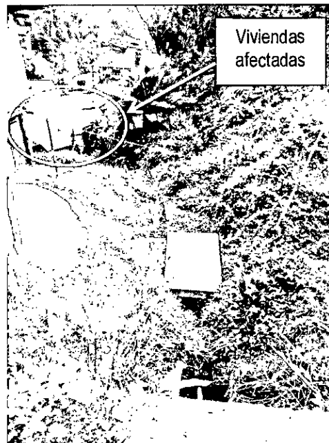
Imagen 1. Sistema de canalización de aguas pluviales.

Las viviendas presentan grandes inclinaciones debido a la ausencia de material de soporte de entre piso, y a la descomposición al que están expuestos por las humedades generadas por el paso del agua por las canales. Estas inclinaciones y asentamientos generan desestabilidad y podría presentarse el desplome de las viviendas.