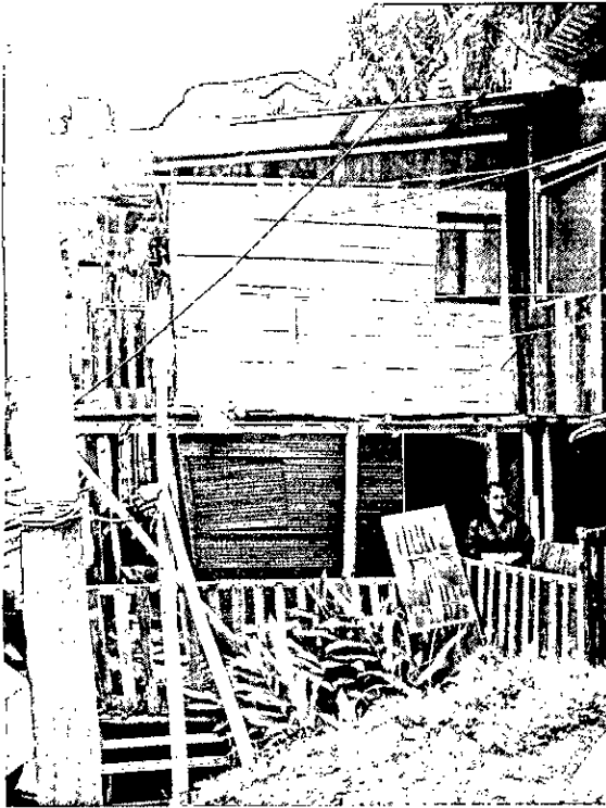
Imagen 2. Vivienda con fuertes inclinaciones