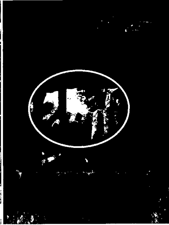
Imagen 3. Residuos sólidos por debajo de la vivienda.