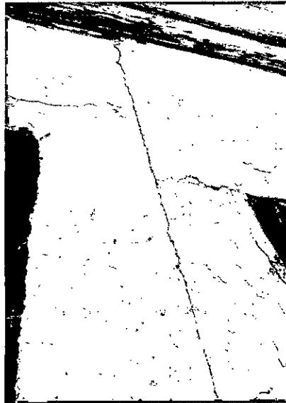
Imagen 4. Deterioro de muros perimetrales.