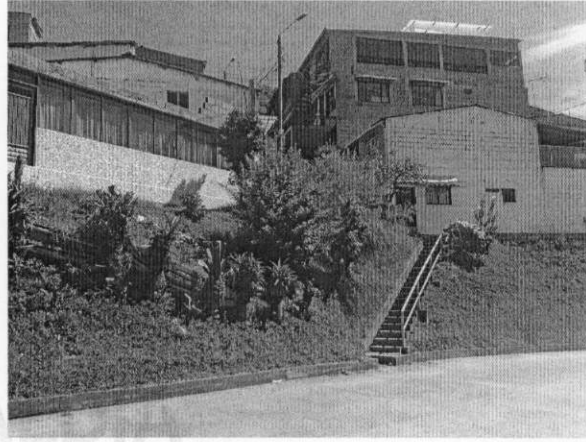
Escaleras ubicadas en el lado opuesto en regular estado