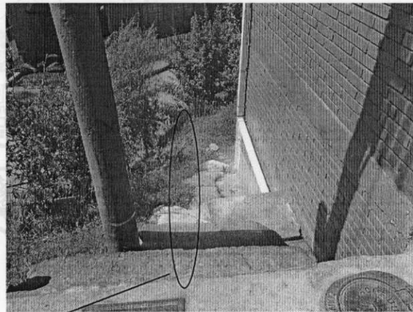
Escalas rústicas que sirven de acceso a viviendas

Longitud de escalas solicitada: 15 Ml aproximadamente